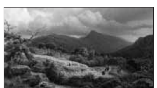
■ Romantisch tafereel van Pierre Dubourcq uit de collectie van het Rijksmuseum.

In de eerste plaats dankzij de keuze van de kunstwerken, die vaak nog in de originele lijsten zitten, maar ook dankzij de compromisloze wijze van presenteren. De schilderijen zijn op de goede hoogte en op flinke afstand van elkaar opgehangen, duidelijk geordend naar thema's als Hemelhooge bergen en Eene zilveren slang .